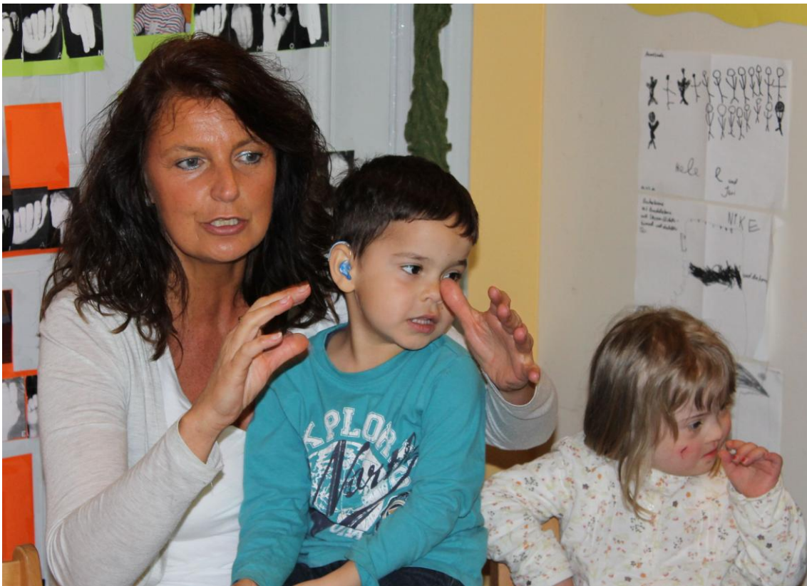
„Massage“ erklären