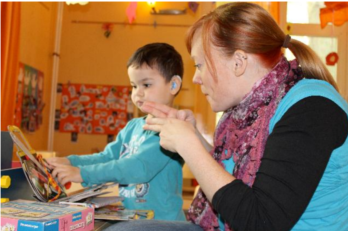
mit Menschen arbeiten