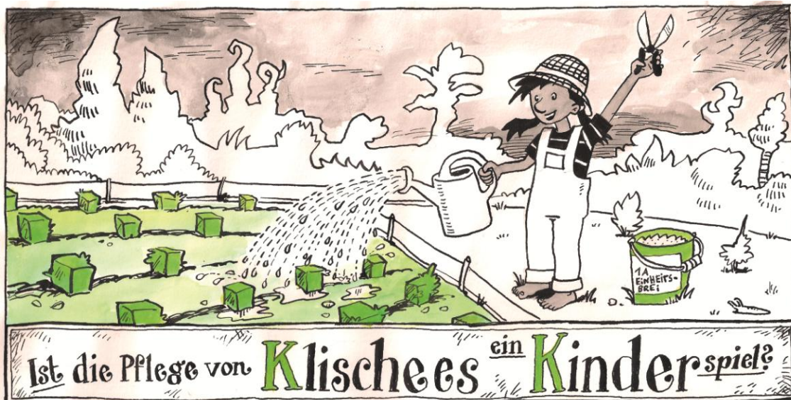
Illustration aus dem Buch "machtWorte!"