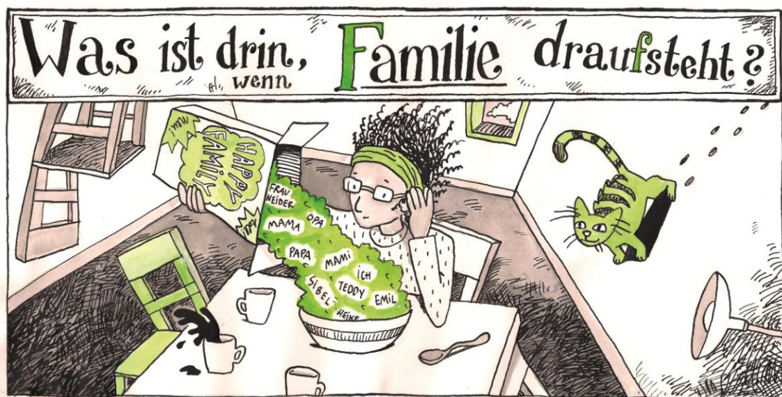
Illustration aus dem Buch "machtWorte!" - © Ka Schmitz

Auch der Begriff „Familie“ steht inzwischen für ganz unterschiedliche Lebensformen jenseits der bürgerlichen Kleinfamilie. Dementsprechend variieren die Lebenswirklichkeiten der Kinder und ihrer Familien, sind Alleinerziehende und Patchwork-Familien ebenso eine Familienform wie „Regenbogenfamilien“. Jenseits von überkommenen Normalitätsvorstellungen alle Familien gleichberechtigt zu behandeln, sollte auch zu einem inklusiven Selbstverständnis von Kitas gehören.