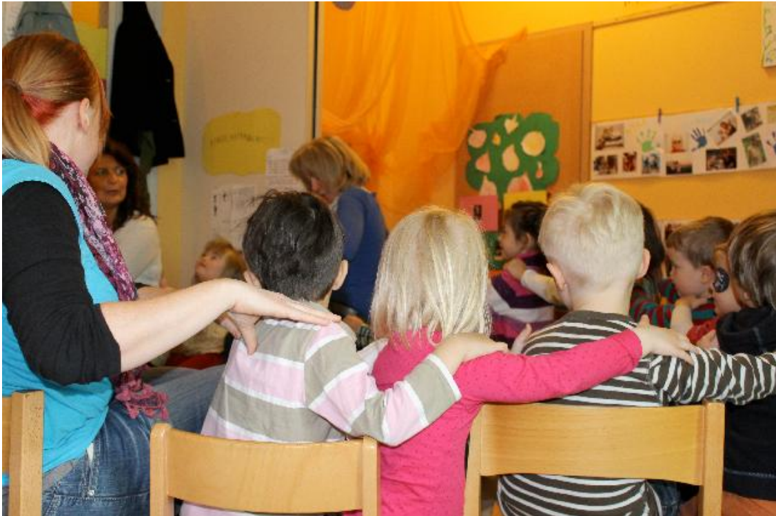
Massage reihum

Dann geht es nach nebenan in den Kreativraum. Rund um einen großen Tisch sitzen die Kinder und fangen an zu basteln, was später Gutscheine über Massagen in unterschiedlichsten Farben werden. Samir bewegt sich souverän in der Runde. Als er eine besondere Farbe haben möchte, geht er zu Lea und gibt ihr durch Gebärden zu verstehen, was er möchte. Sie gibt ihm das Glas, schaut ihm in die Augen und gebärdet dann etwas, was ich wieder nicht verstehe. Aber es ist, als ließen mich ihre Gebärden und seine Reaktion einen stillen Dialog hören. Ich sehe, wie Samir zufrieden an seinen Platz zurückkehrt und sein Werk nach seinen Vorstellungen fertigstellt. Die Farbe hätte sich Samir vielleicht auch ohne Gebärdensprache organisieren können. Aber der leise Dialog, der ihn und Lea in diesem Augenblick verbunden hat, wurde nur möglich, weil Gebärdensprache in der Kita „Paul und Anna“ zum Alltag gehört.