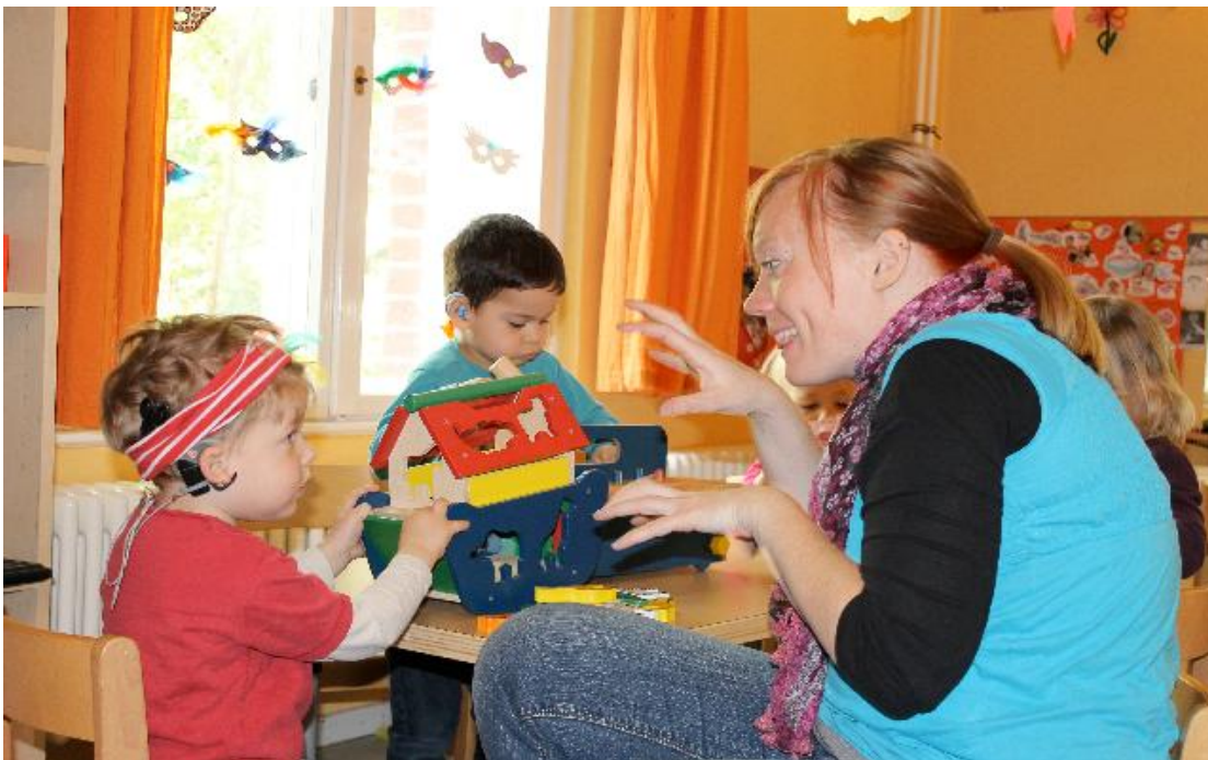
Drei beim Spiel