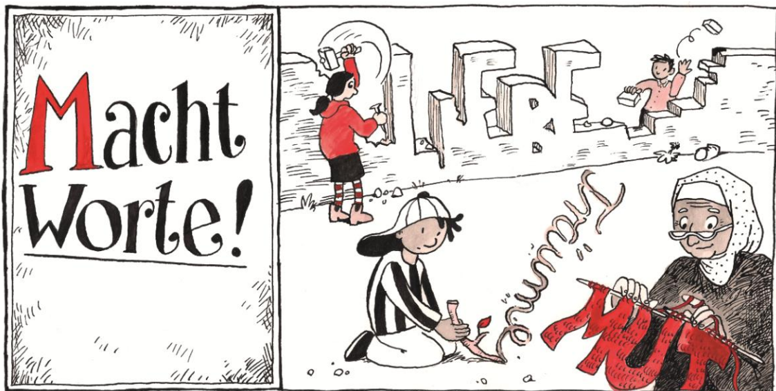
Illustration aus dem Buch "machtWorte!" - © Ka Schmitz

Bereits vor zwei Jahrzehnten entstand in Neuseeland ein inklusives Curriculum für die Arbeit mit kleinen Kindern in unterschiedlichen Einrichtungen. Es ist Ergebnis eines Aushandlungsprozesses zwischen Bildungsorganisationen der Maori und Nicht-Maori, also der hauptsächlich europäischen Immigrant_innen, aber auch Bevölkerungsgruppen der Pazifischen Inseln und des asiatischen Raumes.