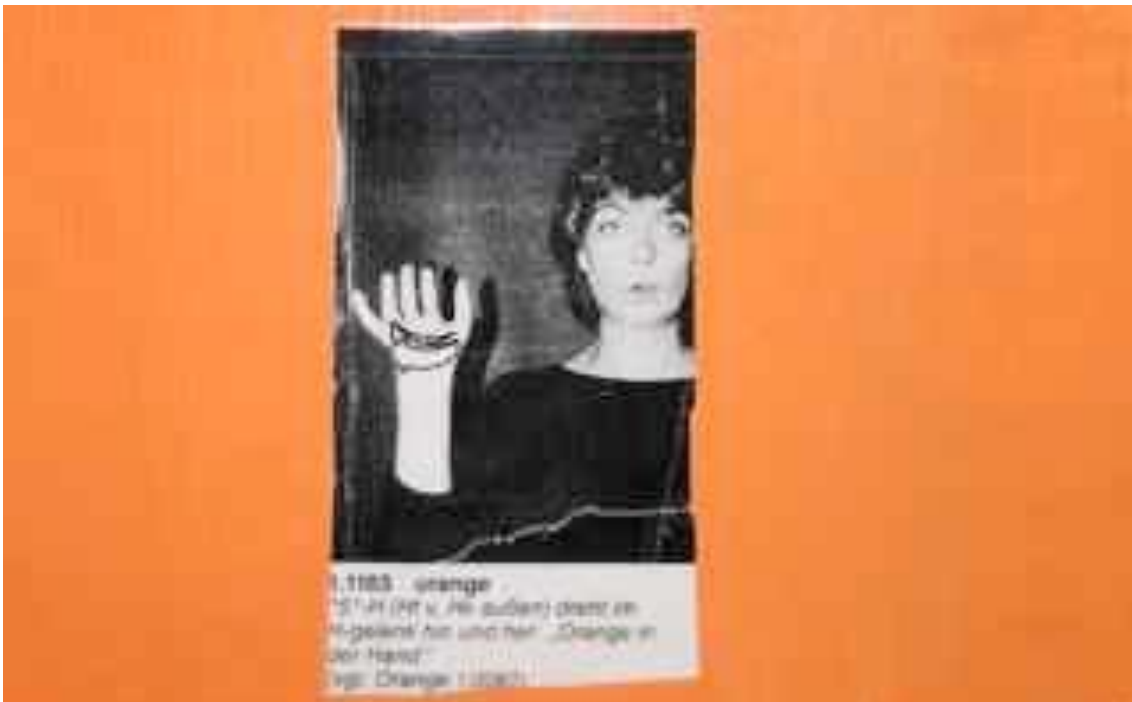
„Orange“ - Bild Elisabeth Gregull

Meine Blicke bleiben an den Kinderfotos auf der Tür hängen. Neben jedem Porträt sind mehrere Fotos von Händen - sie buchstabieren mit Gebärden den Namen des Kindes. An der Wand daneben erblicke ich große rechteckige Farbtafeln – in der Mitte jeweils