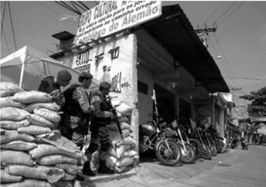
Alltag im Complexo Alemão. In keiner Metropole der Welt tötet die Polizei so viel wie in Rio.

Drogenhändler kontrollieren den Zugang zum Gebiet, verhängen Ausgangssperren, üben Selbstjustiz und verteilen Geschenke. Oftmals sind die lokalen Chefs des Drogenhandels Jugendliche.