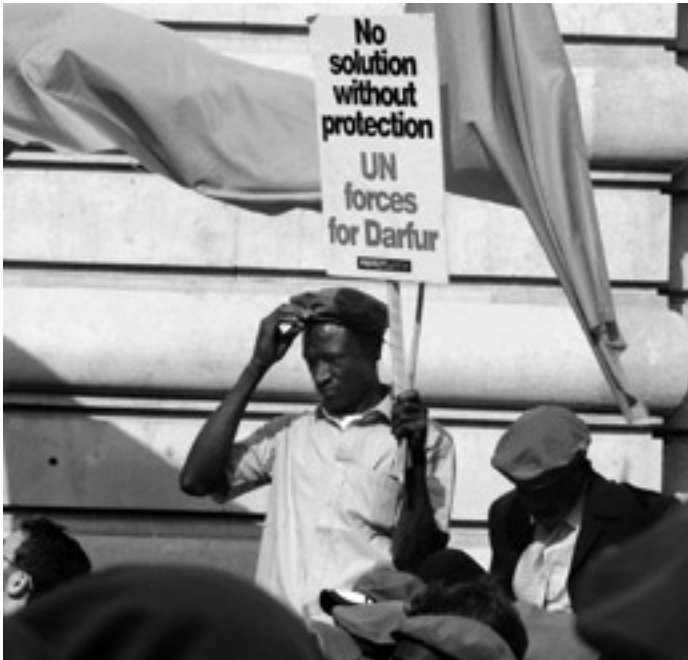
Bitte um UN-Schutz durch die UNO: Demonstration vor der sudanesischen Botschaft in London im September 2006

und ihren Auftrag, die dortige Lage der Menschenrechte nach internationalen Standards zu überwachen und auszuwerten. Die Diplomaten Sudans hatten allerdings in Genf viele Hebel in Bewegung gesetzt, um angesichts der Unvermeidbarkeit einer Mandatsverlängerung den Arbeitsauftrag (und damit den späteren Bericht) auf ein Minimum zu beschränken – und sie waren darin erfolgreich.