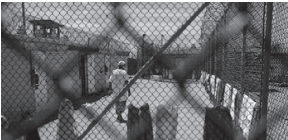
Guantánamo Oktober 2007. Drei Monate später wandte Amnesty International sich mit einer Petition von mehr als 1200 Parlamentariern aus aller Welt an den US-Kongress mit der Aufforderung, das Lager sofort zu schließen.

Ich war sehr nervös, da das Militär diese Gefangenen als die «Schlimmsten der Schlimmen» beschrieben hatte. Doch als Anwältin sollte es mir egal sein, ob mein Klient schuldig oder unschuldig ist. Mein Ziel war, dass die Regierung erklärt, warum sie meinen Klienten gefangenhält, und dass sie Anklage gegen ihn erhebt. Denn nur dann kann er sich wehren.