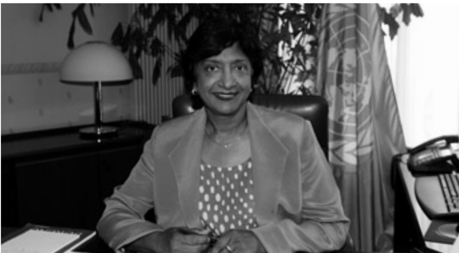
Navanethem Pillay: «Erst war internationale Strafgerichtsbarkeit nur eine Idee und ein Konzept, wir machten daraus eine Realität.»