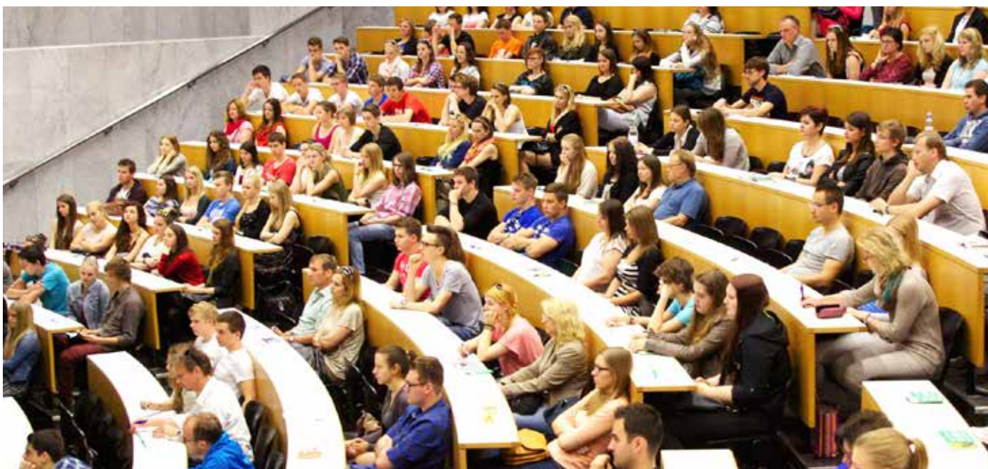
cc-by cc_by_ UniversitätSalzburg

Aber beachte: Nur sehr wenige Studierende können eines der begehrten Stipendien eines Begabtenförderungswerkes bekommen, denn die Anforderungen sind hoch; deswegen informiere dich auch über alternative Möglichkeiten der Studienfinanzierung.