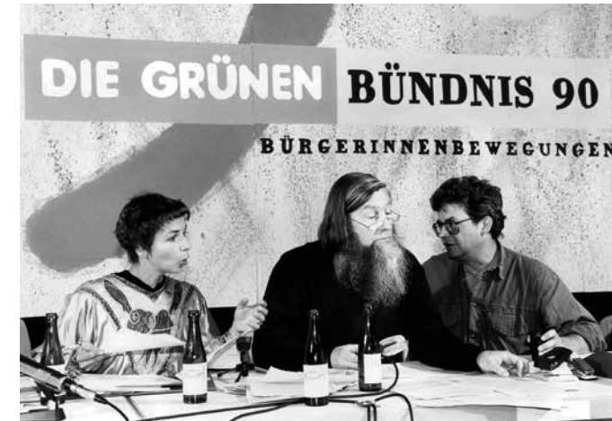
Tagungspräsidium der Bundesdelegiertenkonferenz 1990 in Bayreuth

Die Keimzelle der heutigen Bundesgeschäftsstelle von Bündnis 90/Die Grünen war das Büro für die Wahlkampagne zur Europawahl 1979. Soweit reicht die systematische Überlieferung der Grünen im Archiv Grünes Gedächtnis zurück. 1982 haben die Grünen mit Blick auf die Bundestagswahl 1983 ihre Geschäftsstelle deutlich ausgebaut. Die zentralen Unterlagen sind die Akten des Bundesvorstandes, der Bundesdelegiertenkonferenzen, des Bundeshauptausschusses der Partei, Akten zur Friedens-, Umwelt- und Anti-AKW-Bewegung, Korrespondenzen und Pressemitteilungen sowie die Mitgliederverwaltung der Jahre 1979 bis 1982. Die Dokumente aus der Anfangszeit liefern wichtige Informationen zur Generation der Gründungsgrünen und zur Rolle der Partei in der Umwelt-, Friedens- und Anti-AKW-Bewegung.