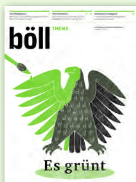
1/13 Es grünt