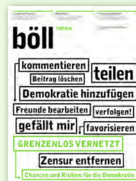
3/12 Grenzenlos vernetzt – Chancen und Risiken für die Demokratie