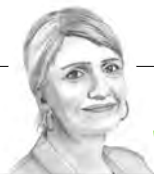
Generationenwechsel bei den Grünen → S. 20

nis mit der Union arbeitet. Gegen eine Pizza-Connection ist nichts einzuwenden – wenn dort Realos und Linke gemeinsam mit den Unionsleuten speisen. Umgekehrt müssen bei Gesprächen mit SPD und Linken selbstverständlich beide Flügel vertreten sein. Das Gleiche gilt auch für die anderen Parteien. Eine echte Annäherung und Auslotung von Gemeinsamkeiten und Unterschieden kann es nur geben, wenn liberale Unionsleute und CSU-Hardliner am Tisch sitzen. Oder wenn bei den Linken eben nicht nur die pragmatischen ostdeutschen Reformer mit in Gesprächskreisen sind.