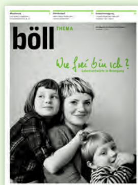
2/13 Wie frei bin ich? – Lebentwürfe in Bewegung

Die Ausgabe 2/13 ist als Printversion vergriffen. Download unter www.boell.de/thema