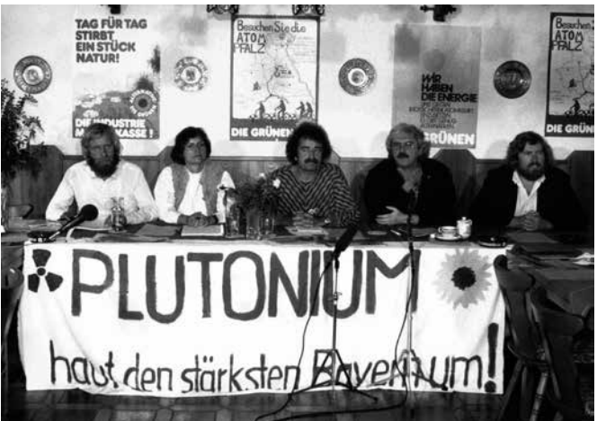
Pressekonferenz der Bundestagsfraktion gegen die WAA in Wackersdorf 1985

Bei der Nutzung ist zu beachten, dass die Verwertungsrechte häufig nicht beim Archiv liegen.